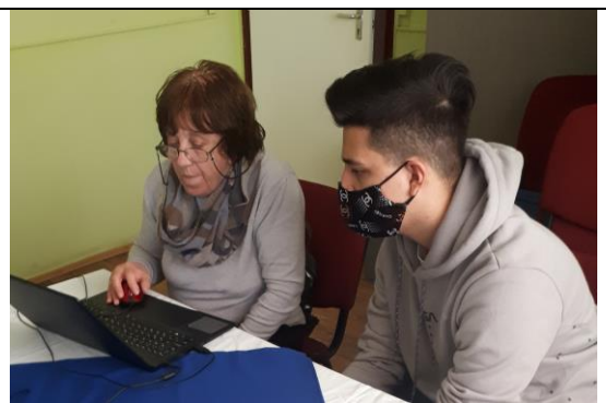
2022. február 23. kezdők középhaladók