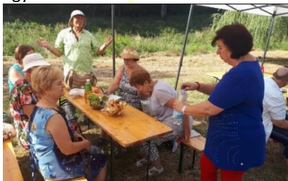
Beszélgetés a sátorban

30-32 különböző civil szervezet képviselői, köztük egyesületünk elnöksége is látogattak el Baranyából Perekedre a Családi és Gasztrofesztiválra, megnézni, meghallgatni a műsorszámokat, újabb ismeretségeket kötni és megkóstolni a „központi” és a csoportonként elkészült lecsókat. A Nyugdíjasok Egyesülete , a Bányászok Érdekvédelmi Kulturális Egyesülete és a Parkinson Betegek Egyesülete képviselőit nagyon sok szervezetet látogattunk meg és mutattuk be egyesületeinket.