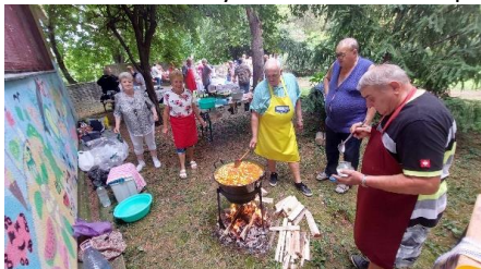
Készül a finom babgulyás

A színvonalas kulturális és sport-bemutatókon túl, főtt a bográcsban a sok finom étel. A Főzőversenyben a BM-esek csapata harmadik helyezést ért el. Gratulálunk!