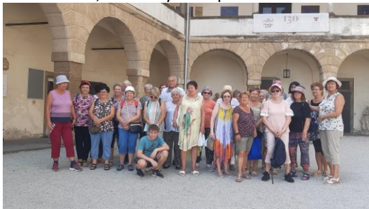
Csoportunk a Ptuj-i várban

Egykori délnyugati határváraink –határok nélkül címmel szerveztünk két napos utazást Horvátországba és Szlovéniába . A 40 fős csoporttal meglátogattuk Varasd, Trakostyán, Ptuj és Csáktornya várát. Jártunk Kumrovecben, Tito egykori szülőházában és a körülötte lévő skanzenben. Mariborban szálltunk meg. A kora délelőtti órákat városnézéssel töltöttük. Hosszú, kanyargós úton jutottunk el Jeruzalemba, ahol helyi ételspecialitásokat és finom borokat kóstoltunk.