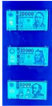
Magyar bankjegyek biztonsági jelei ibolyántúli fényben