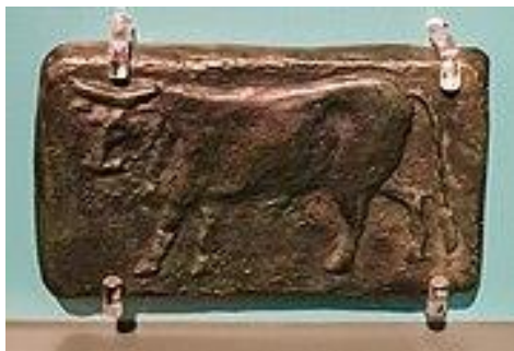
Pénzként használt római réztömb (i. e. 4. század)

A tárlatlátogatás végén saját „pénz”-t is nyomtathattunk, ami FABATKÁ-t ért, de rajta volt saját arcképünk. Másfél órát töltöttünk a múzeumban, de tárlatvezetőnk és mi is úgy gondoljuk, hogy még sok mindent nem láttunk.