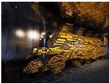
A Szárgulás című kompozíció a Sándy Gyula-közi aluljáróban

A Pénz útja címet viselő állandó kiállítás az interaktivitásra és az egyéni tapasztalatszerzés élményére épül, így volt ez velünk is. A régi pénzürmeket és papírpénzeket nemcsak a vitrinekben csodálhattuk meg, hanem sorra húzogattuk ki a fiókokat, ahol újabb rácsodálkozások voltak. Az ötvenes évek már a mi történelmünk is, így ismerősek voltak a régi 10-20-50-100 Ft-os papírpénzek, a békekölcsönök és telefonkötvények. Kiprobáltuk a csőpostát, ismerősen köszönt a tekerős szorzógép és -telefon. Páran megpróbáltuk az aranytömböt felemelni – persze nem sikerült, – amely mellel 17 kg-ot nyom. Érdekes volt a magyar feltalálók terme, ahol a golyóstoll, dinamó, gyufa, stb. magyar feltalálók képeivel és találmányaikkal is találkozhattunk.