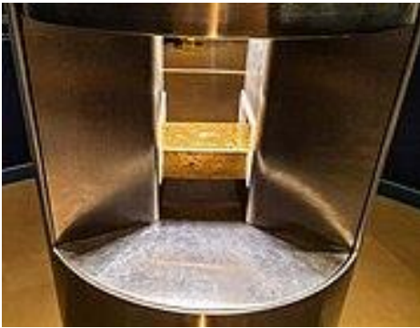
Szabványos aranytömb a múzeumban