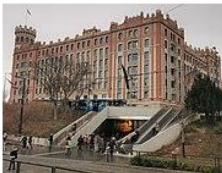
A Postapalota épülete

A három szinten kialakított múzeumban egy élményutat tettünk meg a pénz világában, amelyet interaktív játékok és látványos vizuális bemutatók kísértek végig.